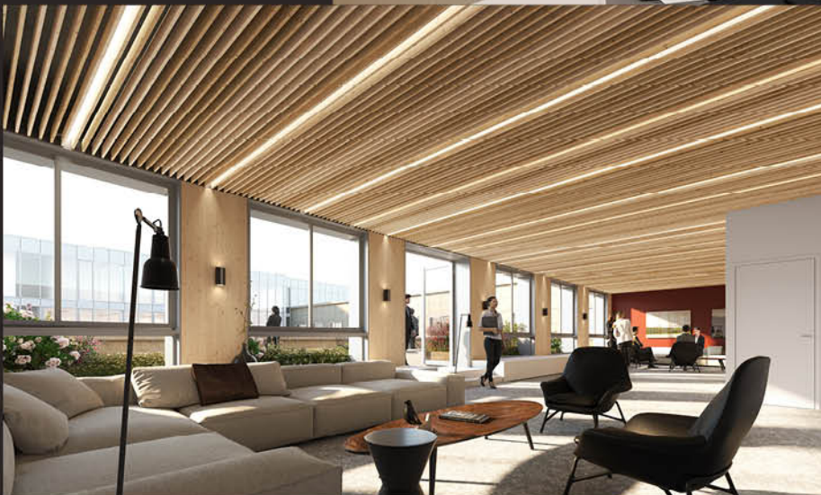
← Salle des partenaires