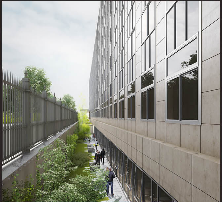
→ Cour anglaise végétalisée