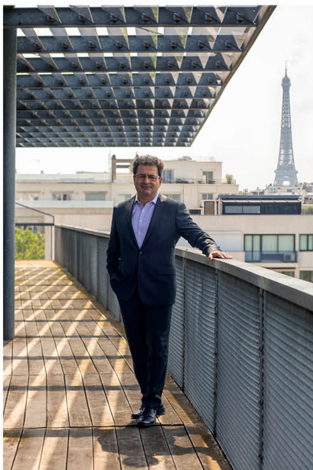
El Mouhoub Mouhoud, Président de l'Université Paris Dauphine - PSL

Il sera mieux connecté à la ville grâce au tramway T3, prolongé de la porte d'Asnières à la Porte Dauphine.