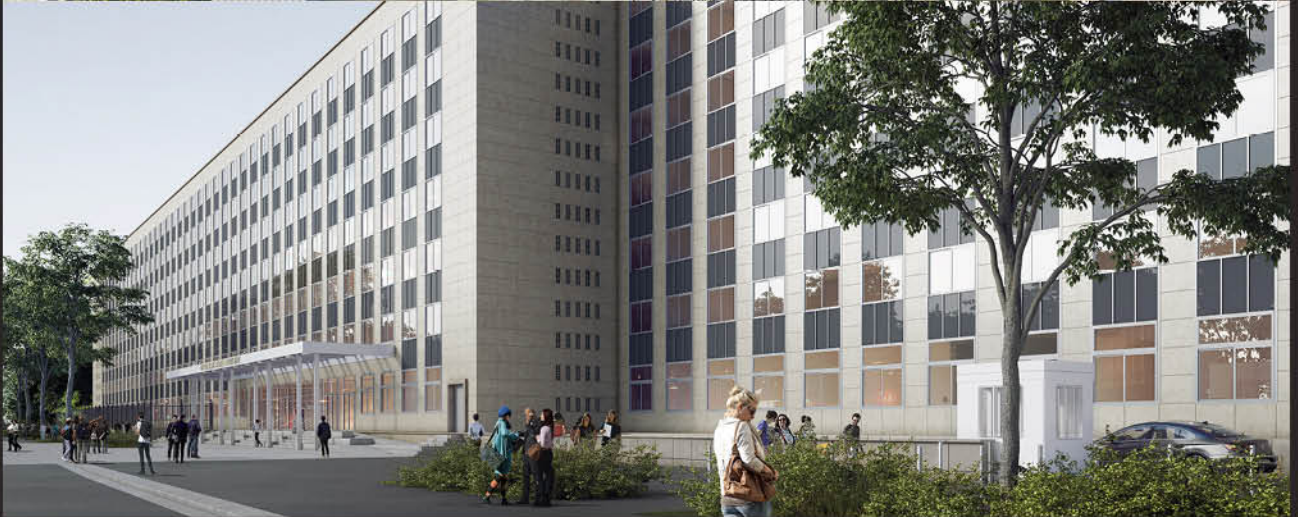
↑ Entrée principale de l'université, boulevard Lannes