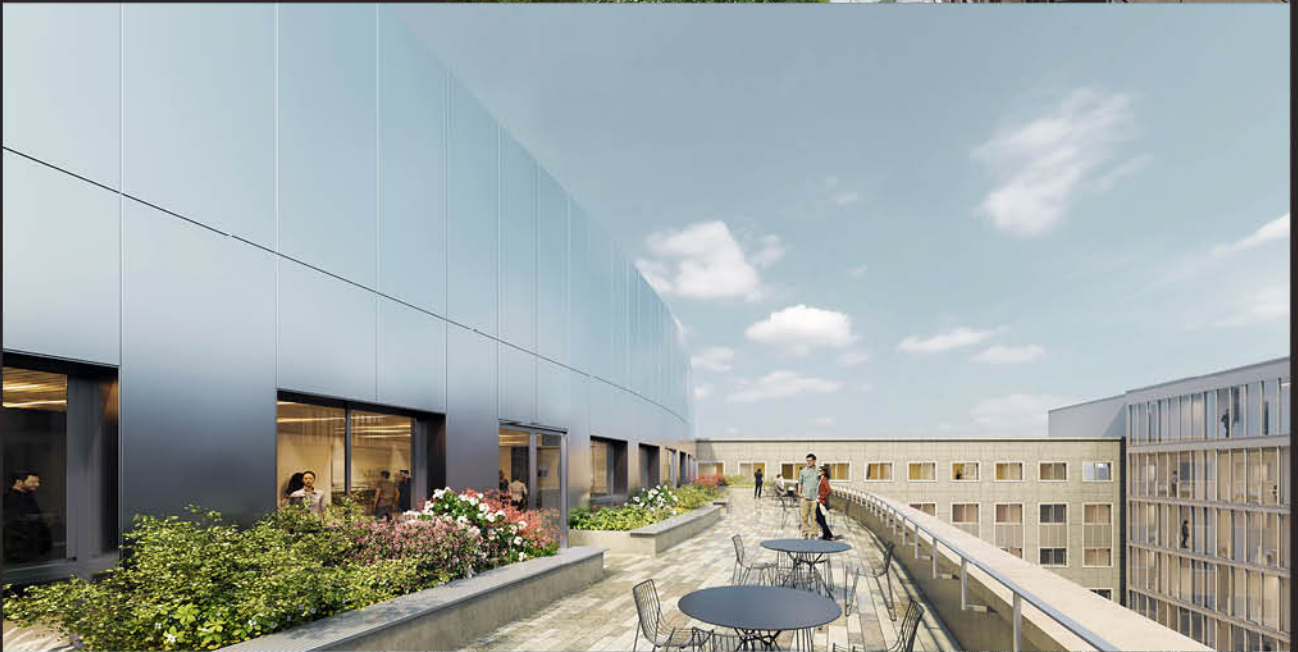
↓ Terrasse de 300 m 2