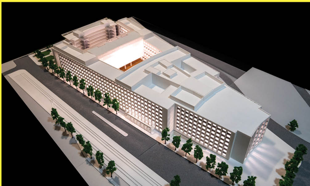
↑ Transformation du campus de l'Université Paris Dauphine - PSL.