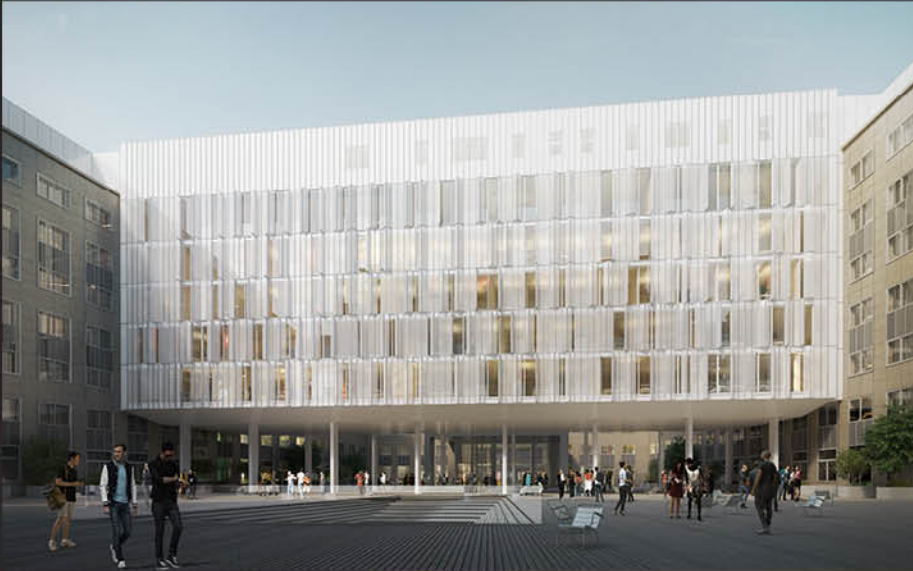
↑ La nouvelle aile, sur pilotis, reliera les bâtiments historiques au-dessus de la cour.