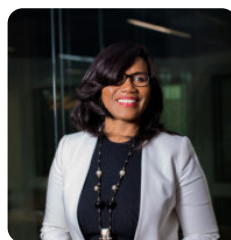
Elisabeth Moreno , Ancienne ministre, Présidente de LEIA, Présidente fondation Femmes@numérique