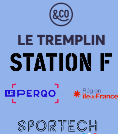
Incubateurs & startups

Vous êtes présents à nos conférences "post expédition" avec les acteurs de la filière sport :